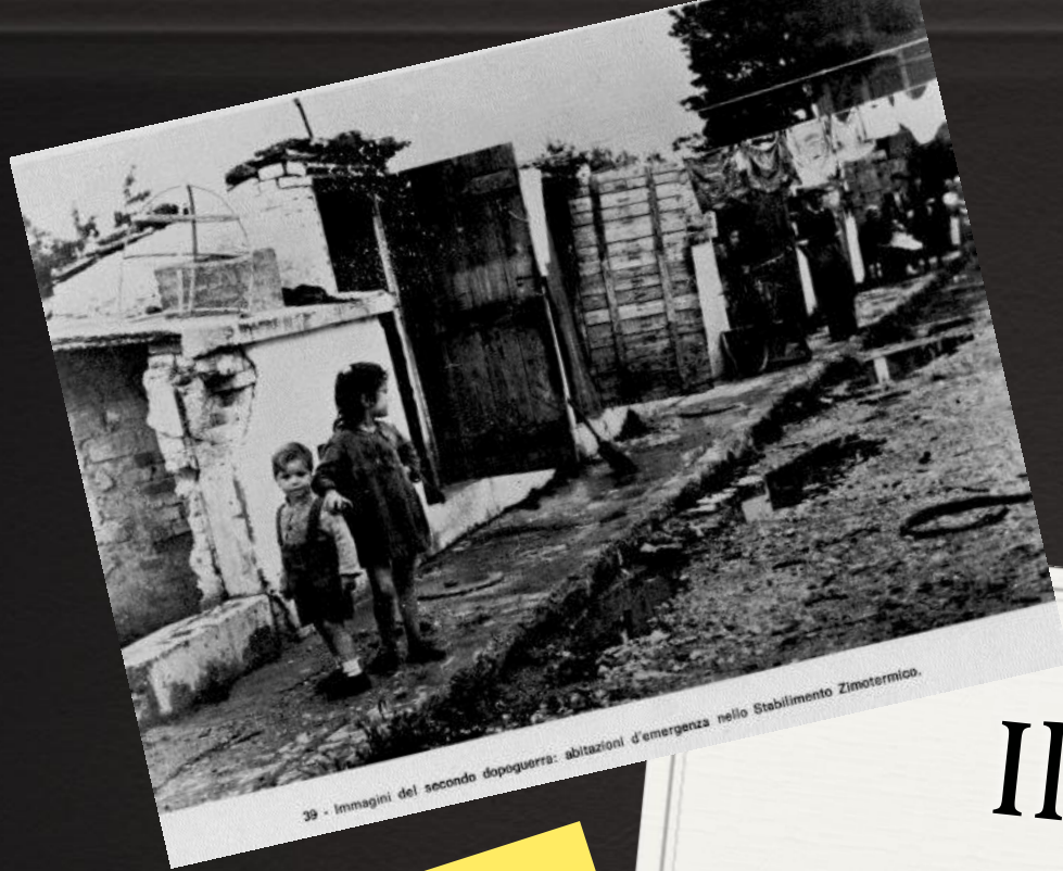
39 - Immagini del secondo dopoguerra: abitazioni d'emergenza nello Stabilimento Zimotermico.

50 milioni di morti 35 milioni feriti 3 milioni dispersi Fame-freddo-mancanza di alloggio Abbandono della terra